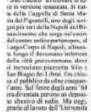
La Cappella Pignatelli

NAPOLI. Sarà il primo della serie dei giardini del grande progetto "Cinto Sordo di Napoli - Sio Vico" a riaprire le porte in versione rinnovata. La sala della Cappella di Santa Maria del Pignatelli, uno degli scrigni più preziosi della Napoli del Risorgimento che negli ultimi duecento anni ha visto il suo splendore scembiare, è finalmente pronta per essere restituita alla città.